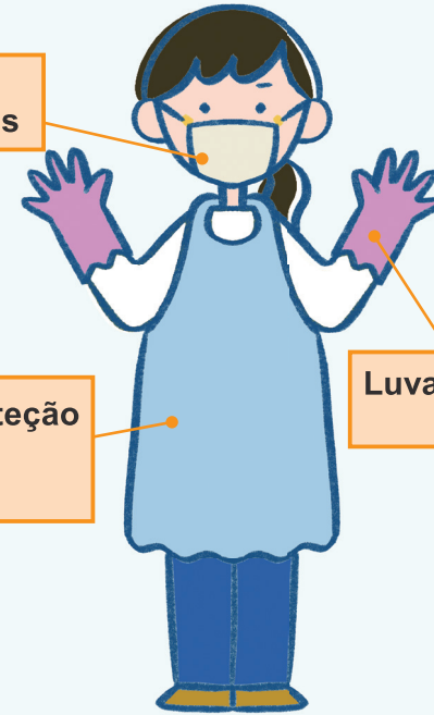
Roupas de proteção ou avental (De vinil)